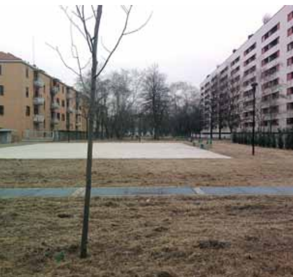
L'area riqualificata dopo l'intervento del Comune

La vicenda dei box interrati di Via D'Azeglio costituiva, fino a qualche settimana fa, una dolorosa spina nel fianco per il Comune di Cusano Milanino. Senza dimenticare le polemiche della scorsa estate sul mancato sfalcio dell'ambrosia e lo stato di abbandono dell'area a verde soprastante (Parco Gramsci).