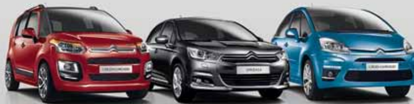
CITROËN C3 PICASSO