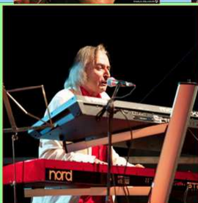
PAKI I Nuovi Angeli