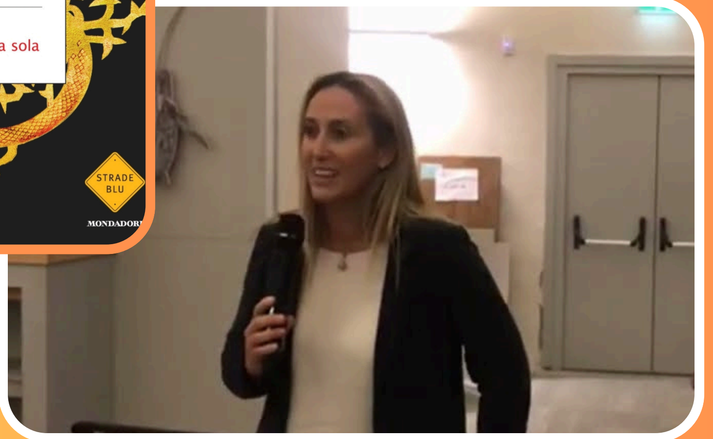
Nicola Gratteri Procuratore di Napoli