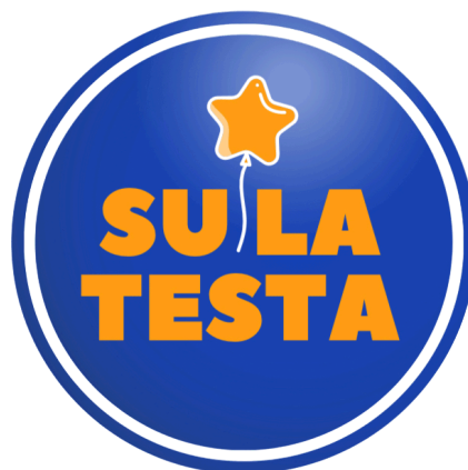
Su la Testa