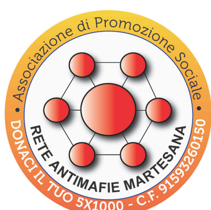
Rete Antimafie Martesana